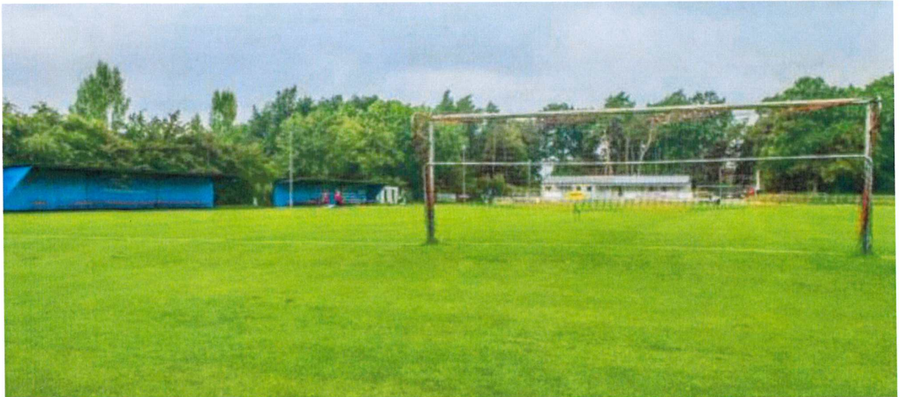
Blick von Süd nach Nord im Waldstadion