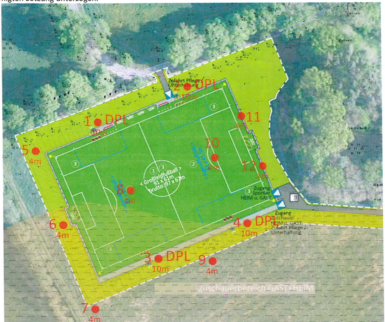
Baugrundmodell unter aktueller Einordnung

Für den Standort liegt ein Baugrundgutachten mit geotechnischem Bericht vor. Im Ergebnis ist festzustellen, dass der Standort mit einer Verbesserung der Tragfähigkeit bzw. Setzungsanfälligkeit des Baugrunds insbesondere der in der SO-Ecke angetroffenen mächtigen hochzersetzten Torfschichten bis 3,50m Mächtigkeit geeignet ist. Die Torfschichten werden im Rahmen einer Baugrundkonsolidierung einer beschleunigten Setzung unterzogen.