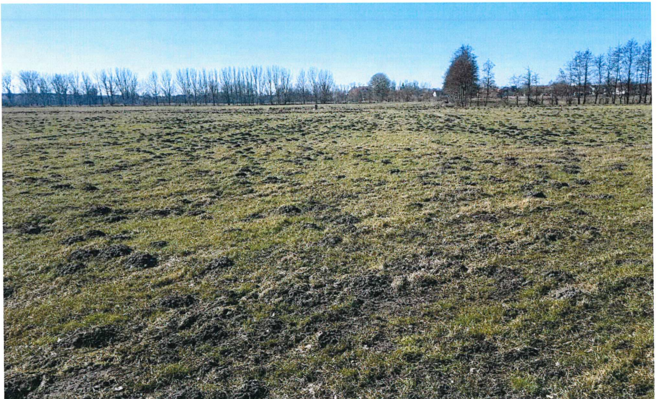
Blick vom Standort Richtung NW