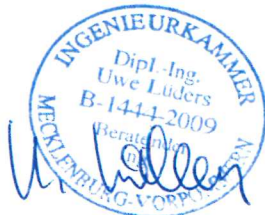
Uwe Lüders, LFP

Kostenermittlung mit Bestand Entwurfsvermessung sowie Baugrund geotechnischer Bericht