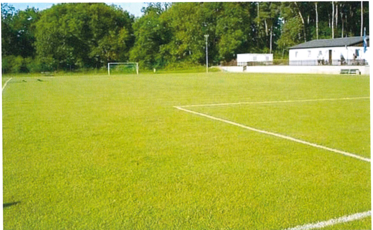
Geplanter Standort im Waldstadion, derzeit Kleinspielfeld