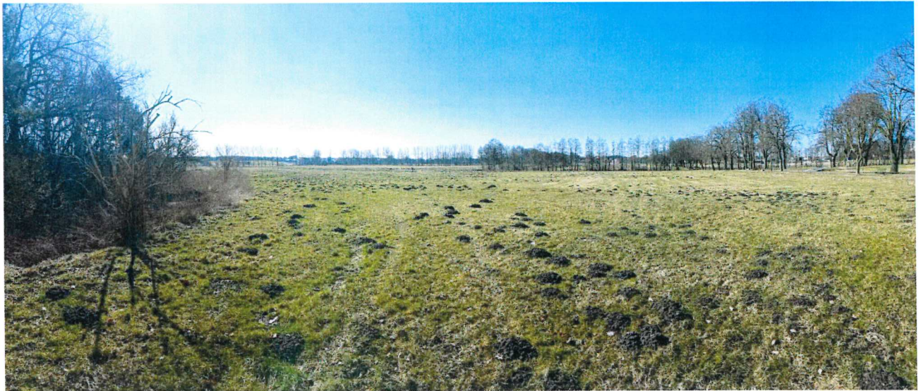
Panoramablick Ri. W auf den Standort