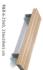
R&R-6-2340, 234x59x45 cm