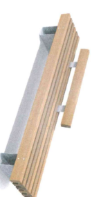
R&R-6-3000, 300x59x45 cm + R&R-1540-Back